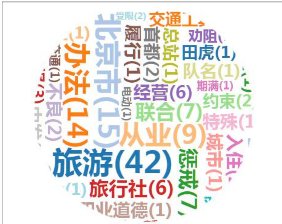
(图4：“在京不文明游客将被限参观景区”热词词频图)