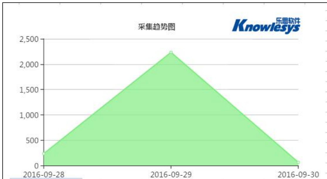
(图 2: “在京不文明游客将被限参观景区”各媒体数据采集趋势图 )

从“在京不文明游客将被限参观景区”各媒体采集趋势图分析，9月24日，各媒体采集中，搜索引擎数据远高于其他媒体，并一直占据成为主要数据来源。从数据的来源 TOP 5 网站图可知，新浪微博作为自媒体在传播过程中的推动作用不容小觑。