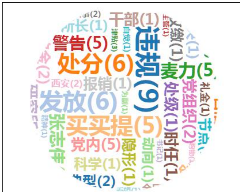
(图1：“新疆区纪委通报三起违规发放津补贴和福利典型问题”热词词频图)

根据环球网发布的新闻“新疆区纪委通报三起违规发放津补贴和福利典型问题”原文分析所得，词云图中关键词“违规”字体最大，且出现了9次，成为了热词词频的主题词，也是舆情的焦点所在；其次关键词“处分”和“发放”“警告”分别出现了6次和5次，关注度分居二、三位。