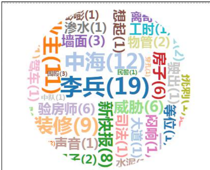
(图5：“验房师”挑刺”太多遭4名男子围殴”热词词频图)