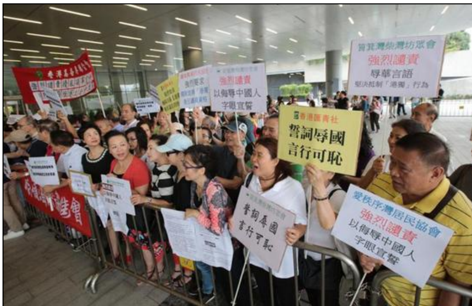
(图 1：香港市民到立法会外示威，痛斥梁、游二人辱华言论)

据大公网援引 TVB 新闻最新报道，香港立法会主席梁君彦 2016 年 10 月 18 日裁定梁颂恒、游蕙祯、姚松炎、黄定光，以及刘小丽五名立法会议员宣誓无效，准许五人重新宣誓。