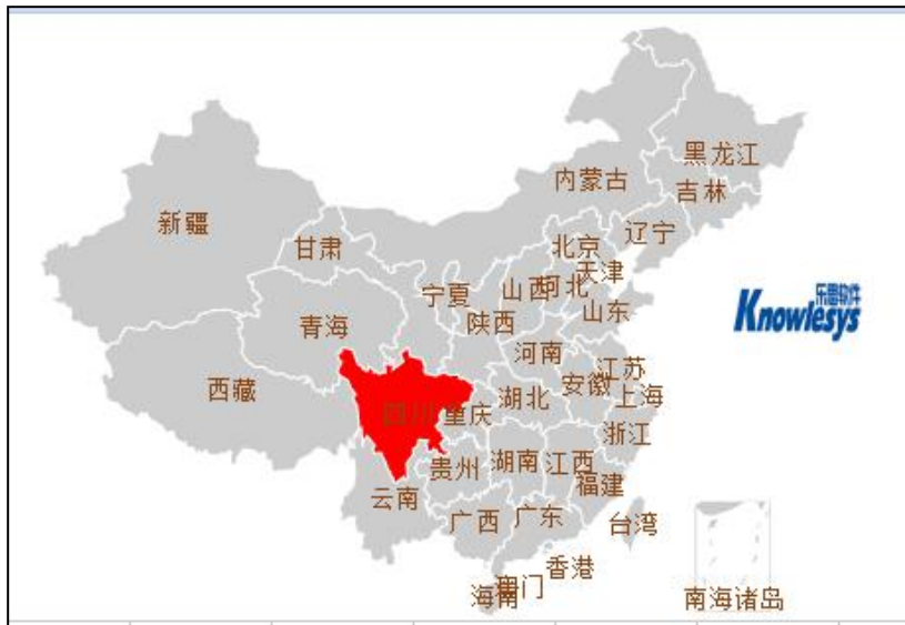
(图 3：“智障男子被传唤死在派出所”地域舆情分布图)