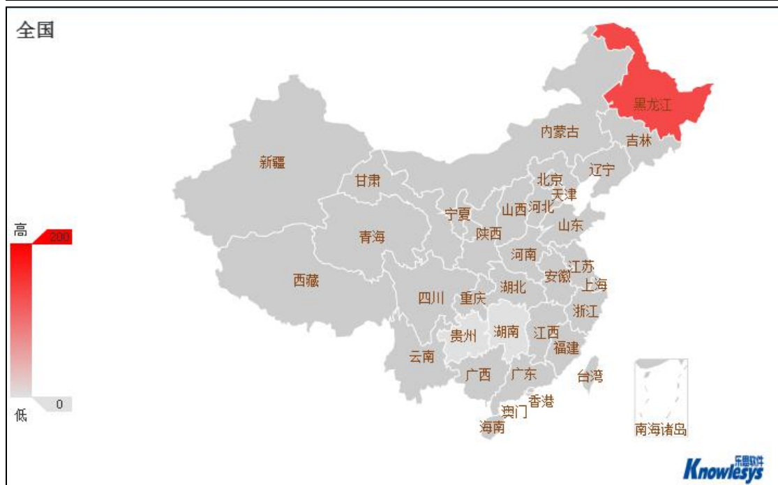
(图 6: 地域舆情分布图)