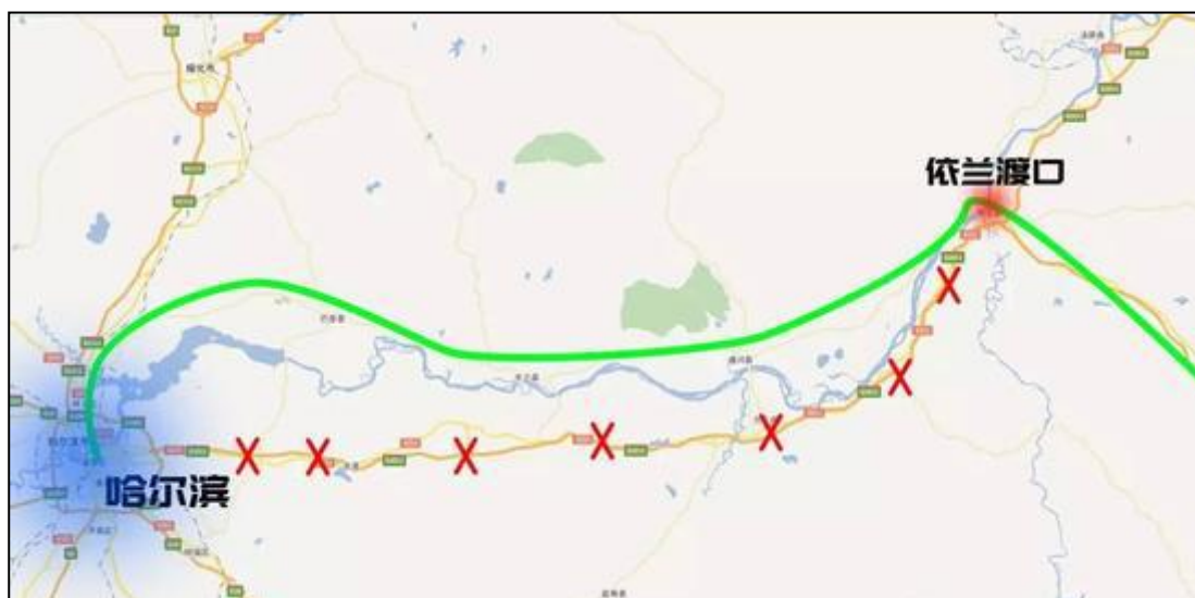
(图 2: 超载车绕行线路图)